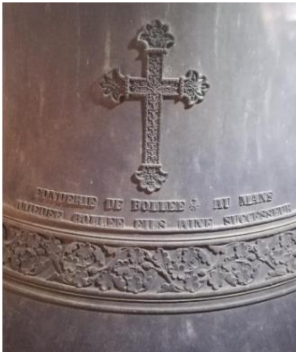
3/ FONDERIE DE BOLLEE * AU MANS AMEDEE BOLLEE FILS AINE SUCESSEUR