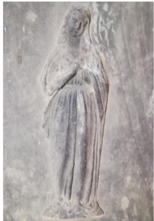
4/ VIERGE AUX MAINS CROISÉES