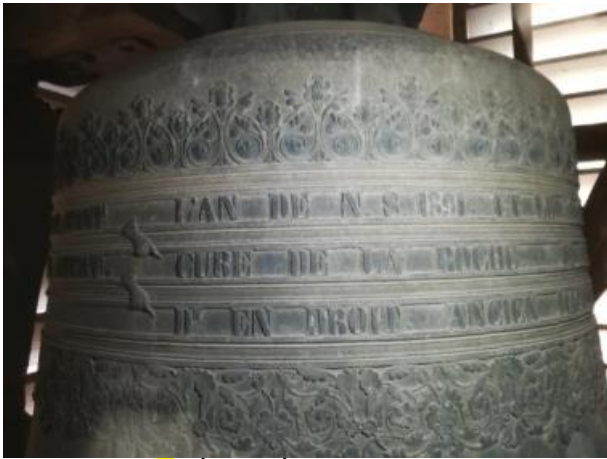
1/ DÉTAILS ÉPIGRAPHIQUES