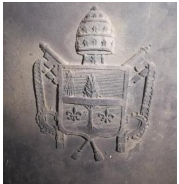
6/ ARMOIRIES PAPALES LÉON XIII, PAPE DE 1878 À 1903