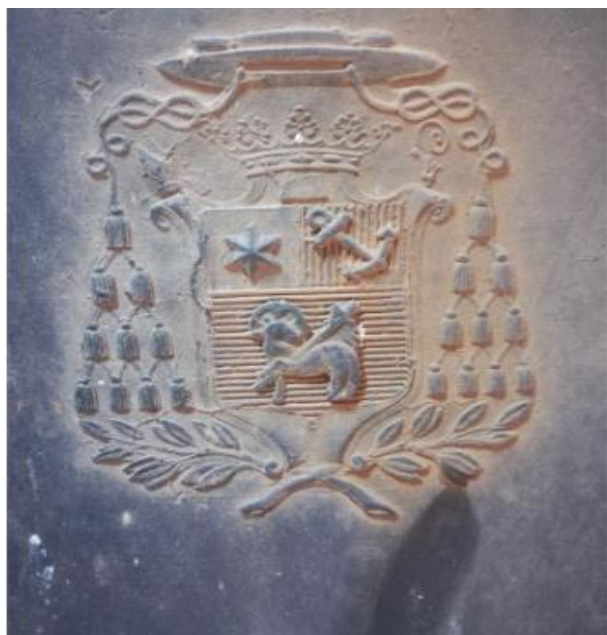
5/ ARMOIRIES DE CLOVIS-NICOLAS-JOSEPH CATTEAU ÉVÊQUE DE LUÇON DE 1877 À 1915