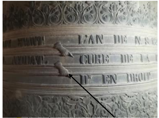
2/ DÉTAILS ÉPIGRAPHIQUES - SAUT DE LIGNES